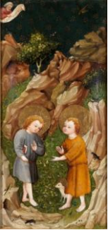
Oberrheinischer Meister Besuch des Jesusknaben bei Johannes in der Wüste, um 1410/20

Die Bilddaten dürfen nur im Zusammenhang mit der Ausstellung „Unter freiem Himmel“ im Rahmen der aktuellen Berichterstattung (ab 3 Monate vor Ausstellungsbeginn bis 6 Wochen nach Ende der Ausstellung) verwendet werden. Die Werkabbildung darf nur vollständig und unverändert erfolgen. Die Verwendung für Produktwerbung durch Sponsoren sowie Kooperations- und Werbepartner ist lizenz- und gebührenpflichtig; bitte wenden Sie sich an bpk-Bildagentur (kontakt@bpk-bildagentur.de) beziehungsweise an die VG Bild Kunst (info@bildkunst.de).