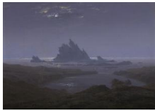
Caspar David Friedrich Felsenriff am Meeresstrand, 1824