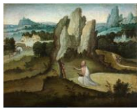
Joachim Patenier Felslandschaft mit dem büßendem Heiligen Hieronymus um 1475-1480 – 1524