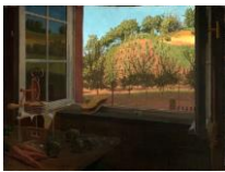
Georg Scholz Blick aus dem Küchenfenster, 1926