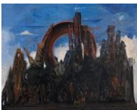
Max Ernst Der Wald, 1927 © VG Bild-Kunst, Bonn 2017