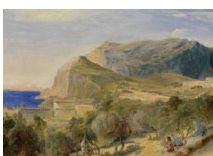
Karl Blechen Blick auf den Monte Castiglione in Capri, 1829

Kontakt Presse und Medien T +49 721 926 3890 presse@kunsthalle-karlsruhe.de