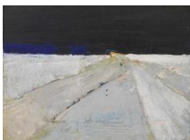
Nicolas de Staël Landschaft, 1953 © VG Bild-Kunst, Bonn 2017