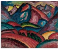
Alexej Jawlensky Oberstdorfer Landschaft, 1912