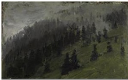
Franz Marc Nebel zwischen Tannen, 1905