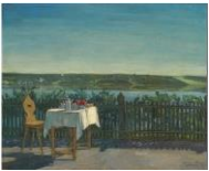
Wilhelm Trübner Kaffeetisch am Starnbergersee, 1909