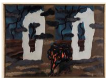
René Magritte Le goût d'invisible, 1927