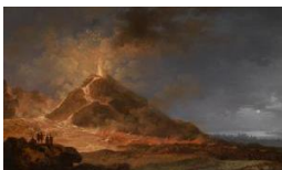
Pierre Jacques Volaire Der Ausbruch des Vesuvs am 14. Mai 1771, nach 1771