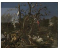
Franz de Hamilton Konzert der Vögel, 1650 - 1695