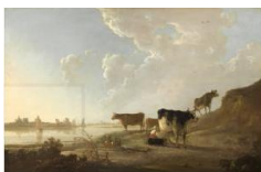
Aelbert Jacobsz. Cuypp Flusslandschaft mit melkender Frau, um 1646