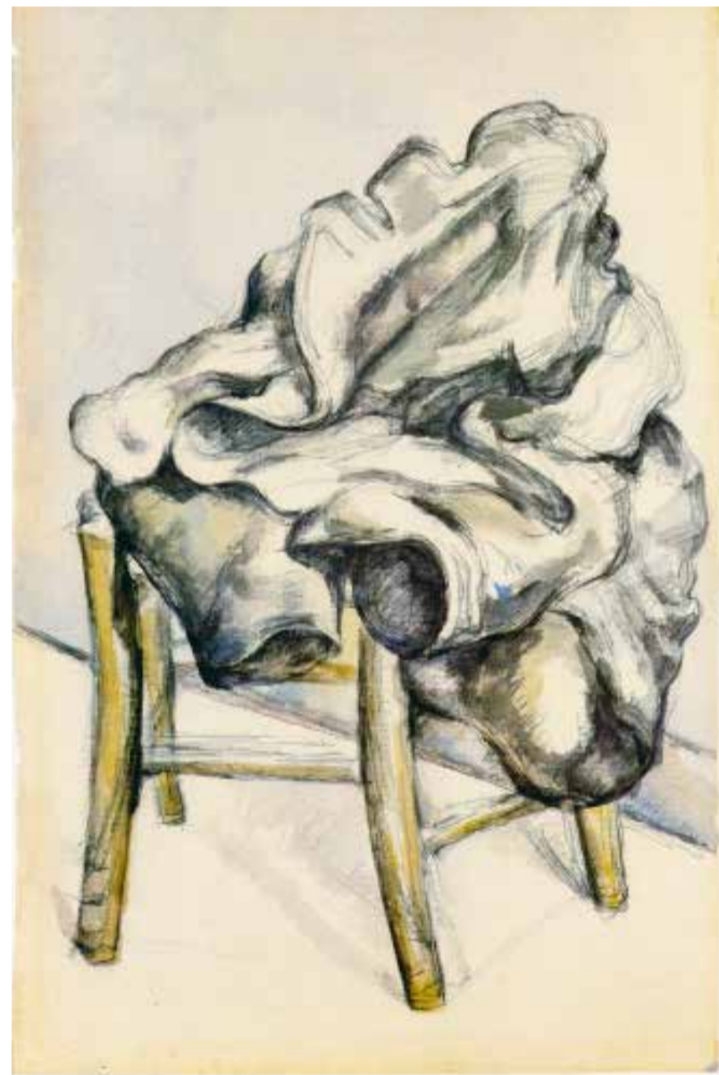
Paul Cézanne, Jacke auf einem Stuhl, 1890-1892

Das Ausstellungshighlight des Jahres in der Staatlichen Kunsthalle Karlsruhe