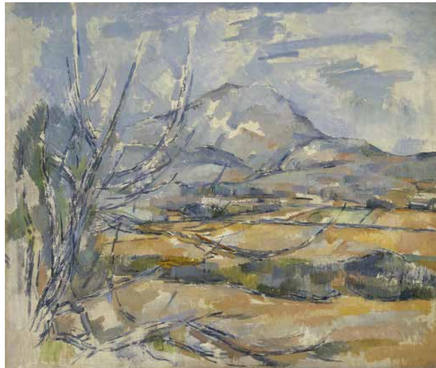
Paul Cézanne, Montagne Sainte-Victoire, 1890-1895

Wer kennt sie nicht, die berühmten Badenden, die kraftvollen Landschaften, die Porträts und Stillleben von Paul Cézanne? Der Meister aus Aix-en-Provence hat als Maler, Zeichner und Aquarellist ein überaus facettenreiches Werk geschaffen. Viele dieser bekannten und berühmten Bilder sind nun in der Staatlichen Kunsthalle Karlsruhe in der Ausstellung Cézanne. Metamorphosen versammelt.