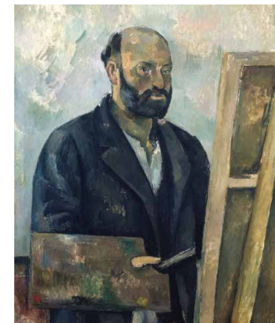
Paul Cézanne, Selbstbildnis mit Palette, um 1890